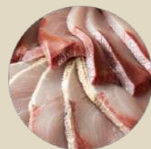
ブリ しゃぶしゃぶ