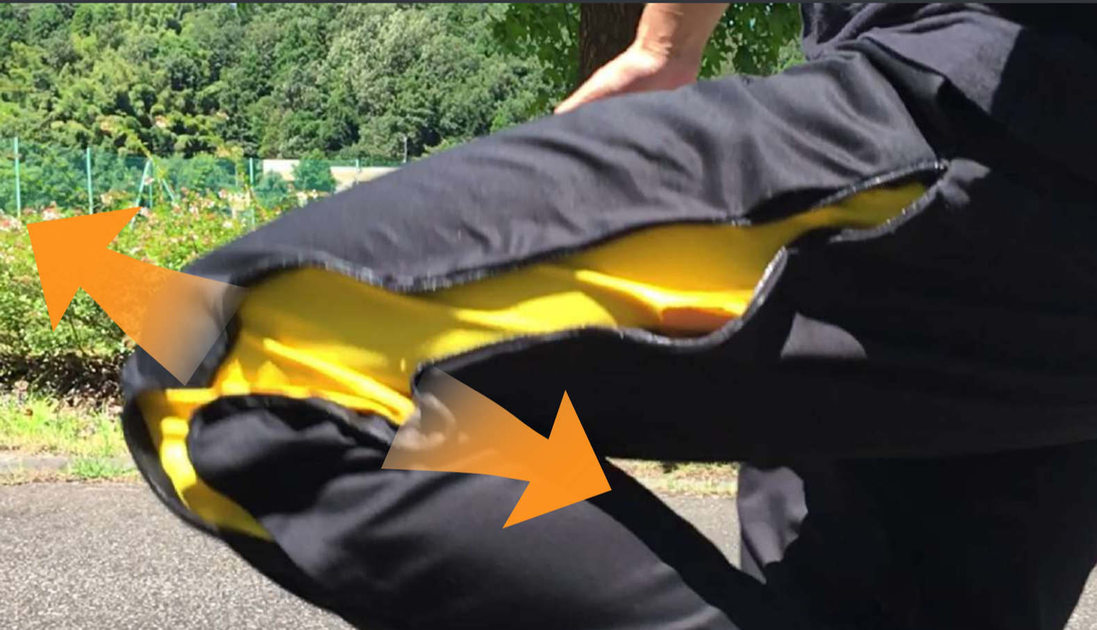
高い伸縮性で運動をサポート。