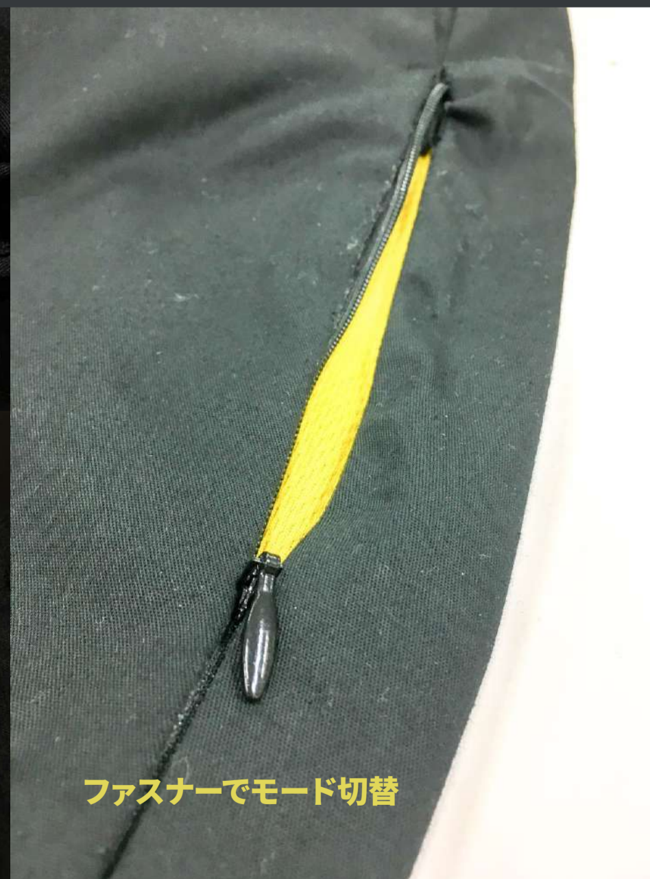
ファスナーでモード切替

ビジネスで使えるスラックス 側面のファスナーを開けると... スポーツモード 通気性と伸縮性が向上